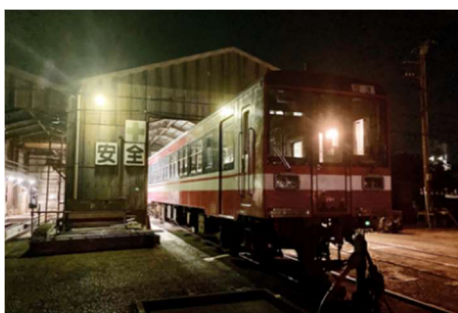
☆ 使用車両(鹿島臨海鉄道6000形)

https://n-tabeat.jtb.co.jp/tabeat/List.aspx?TourNo=7ab9aa2fd5f0475f9832d04a